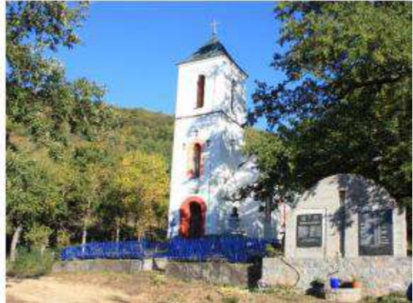
Слика 2. и 3. Црква Покрова Пресвете Богородице