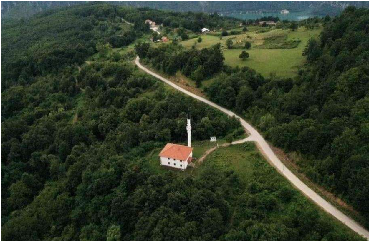
Слика 8. Џамија у селу Луке

Од тада па све до данашњих дана, џамија у Осату је била центар духовног живота и окупљања муслиманског Бошњачког становништва са простора Осата. Будући да су стољећа након изградње џамије била веома бурна, обиљежена честим ратовима и бунама, џамија је током свог постојања више пута рушена и паљена, да би након тога сваки пут била поново обновљена од стране самих мјештана. У посљедњем рату (1992.-1995. године) у потпуности је срушена минарањем у прољеће 1993. године од стране војске и полиције РС-а. Поново је обновљена донацијом кувајтског народа и прилозима џематлија са овог простора, након процеса повратка прогнаног Бошњачког становништва на подручје Осата. Свечано је отворена 10. јула 2008. године.