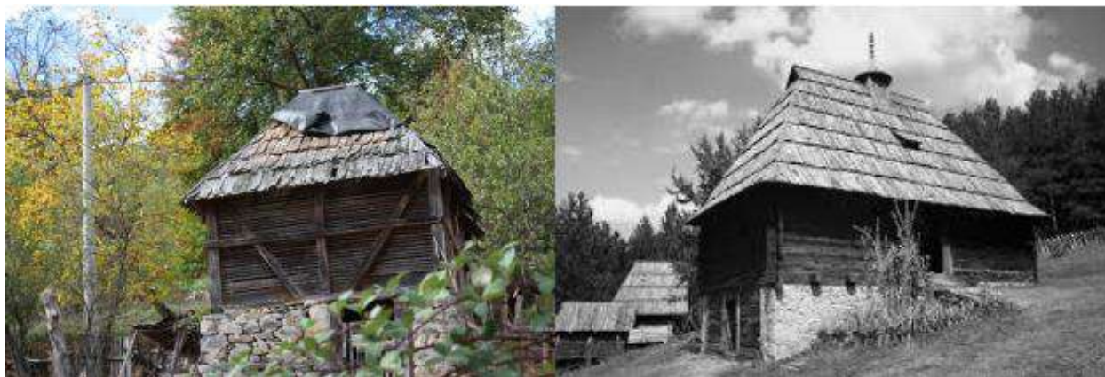
Слика 5. Осаћанска кућа –помоћни објекат, Слика 6. Типичан изглед осаћанске куће

У обухвату Националног парка „Дрина“ тренутно се не налази ни једна типична дрвена са каменом подзидом (слика 6. и слика 7.) осаћанска кућа. Постоји неколико кућа зиданих (камених) на потезу од села Клотијевац до села Међе и неколико кућа у селу Луке. План управе Националног парка „Дрина“ (а започете су и одређене сктивности) је, да се у порти манастира Покрова Пресвете Богородице, за почетак, направи реплика осатске куће и прикупи унутрашњи мобилијар. То би био својеврсни музеј на отвореном који би приказивао начин и услове живота у том времену. План је да се направи цијело једно мало осатско насеље.