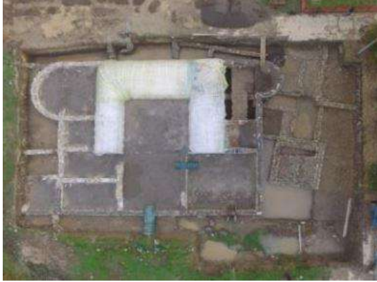
Слика 10. археолошки локалитет Municipium Malvesiatium