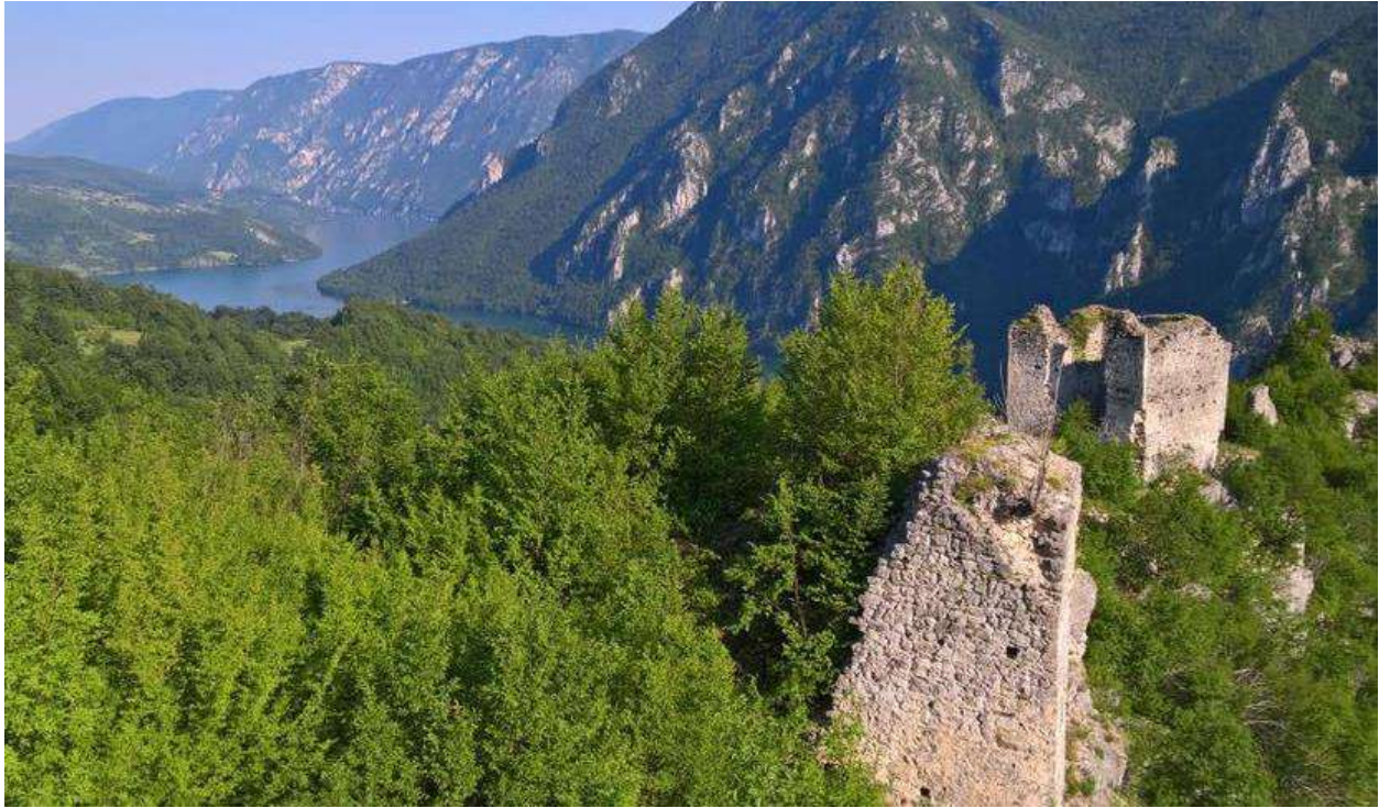
Слика 9. Стари град Клотјевац

Ђурђевац 1 (Градина) - средњовјековни град. На истакнутом вису изнад лијеве обале Дрине видљиви су остаци квадратне куле и дворишта.