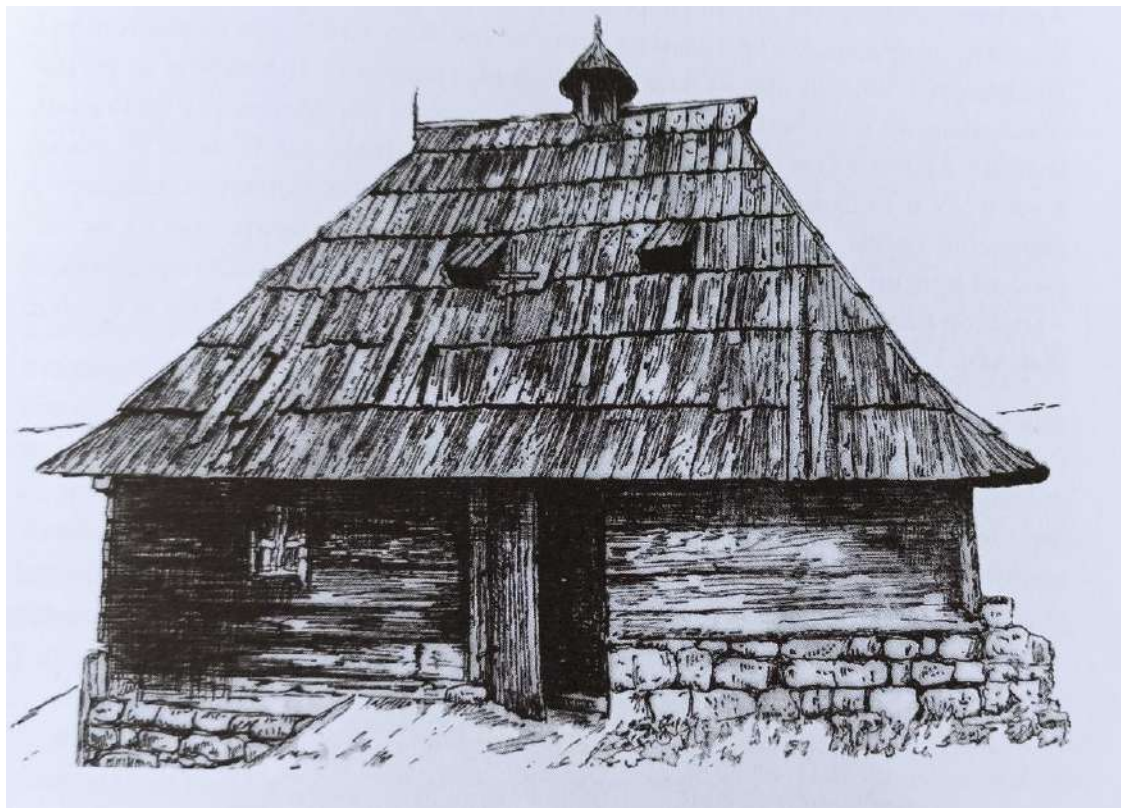
Слика 7. Осаћанска кућа на Златибору, цртеж