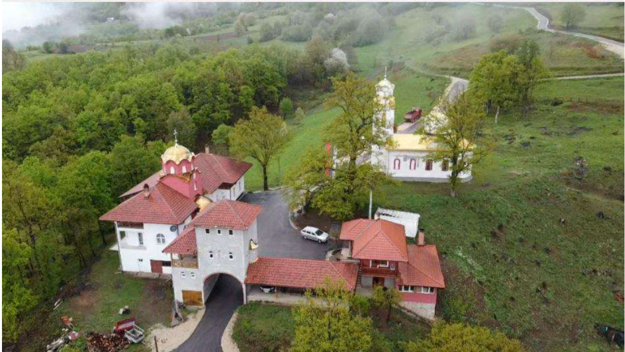
Слика 1. Поглед на манастир Карно

љубави и дивне добродошлице; онај најдражи осјећај припадности, као када се враћамо кући, најближима.