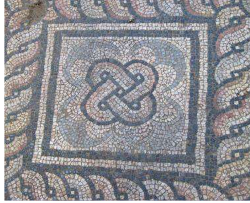
Слика 11. Детаљ мозаика