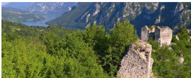
Stari grad Klotjevac

Srednjovjekovni grad Klotjevac sagrađen je na litici rijeke Drine, a svojim izgledom pokazuje da je imao funkciju utvrde iz koje se kontrolisao prolaz kanjonom Drine. Izuzetno atraktivan, zbog nepristupačnosti terena do njega mogu doći samo najsmjeliji avanturisti. Činjenica da se samo 7 km nizvodno nalazi još jedna srednjovjekovna utvrda- srednjovjekovni grad Đurđevac, pokazuje historijsku važnost ovog kraja. Nekropole stećaka „razasute“ u tom području opštine Srebrenica, a koje gravitiraju u okolini Klotjevačkog grada kao što su: Zlatovo kod sela Ljeskovik, Zaelisije, Urisići, Lubničko brdo i druga pokazuju kontinuitet življenja odavnina na ovim prostorima.