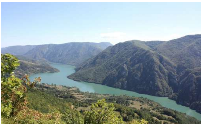
Pogled na Drinu sa vidikovca Bijele vode

Kanjon rijeke Drine sa nalazištima Pančićeve omorike i znatnim brojem drugih endemičnih i reliktnih vrsta, autohtonom faunom, te arheološkim nalazištima iz raznih epoha predstavlja jedinstven ambijent u Nacionalnom parku Drina.