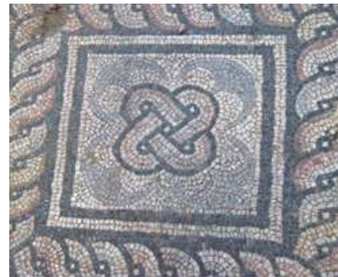
Detalj mozaika - Municipijum Malvesiatium