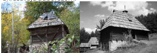
Osaćanska kuća –pomoćni objekat, Tipičan izgled osaćanske kuće selo Luke Nacionalni park „Drina“

Osaćani su utemeljili takozvani „dinarski“ tip srpske kuće iz koga će nastati sve ostale varijante seoske kuće. Poznata i kao osaćanka, ova tipična zgrada narodnog neimarstva sastoji se od kuće i sobe. Osaćanka ima strm krov pokriven šindrom i fino obrađene drvene grede koje se često ukrašavaju duborezom.