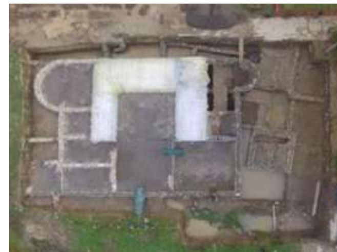
Arheološki lokalitet Municipijum Malvesiatium

Na području NP „Drina“ nalazi se 11 dobro očuvanih arheoloških lokaliteta, među koje se ubrajaju srednjovjekovni gradovi, srednjovjekovna groblja, rimski nadgrobni spomenici, ostaci rimske zgrade i kasnoantičke grobnice, kao i rimski muzej “Municipijum Malvesiatium” u Skelanima.